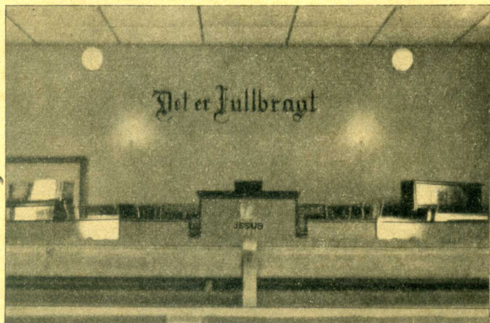
Interiør av Betania