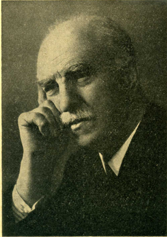
Pastor T. B. Barratt