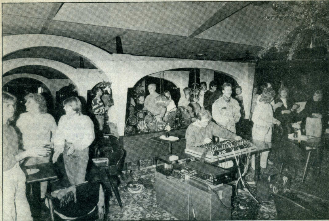
Omlag 50 mennesker møttes til konsert på Carina.